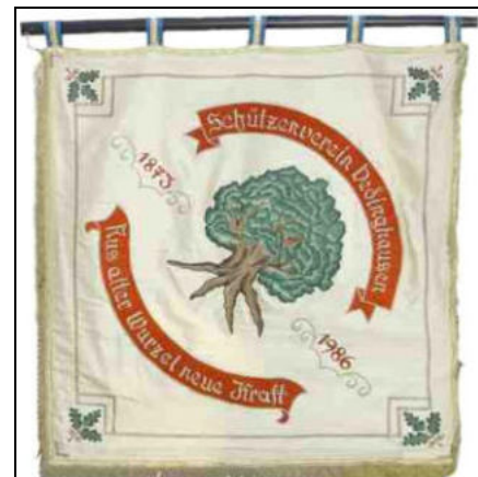
Fahne der 2. Kompanie