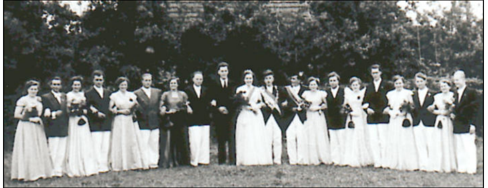
Das Bild zeigt das Königspaar mit seinem Hofstaat: