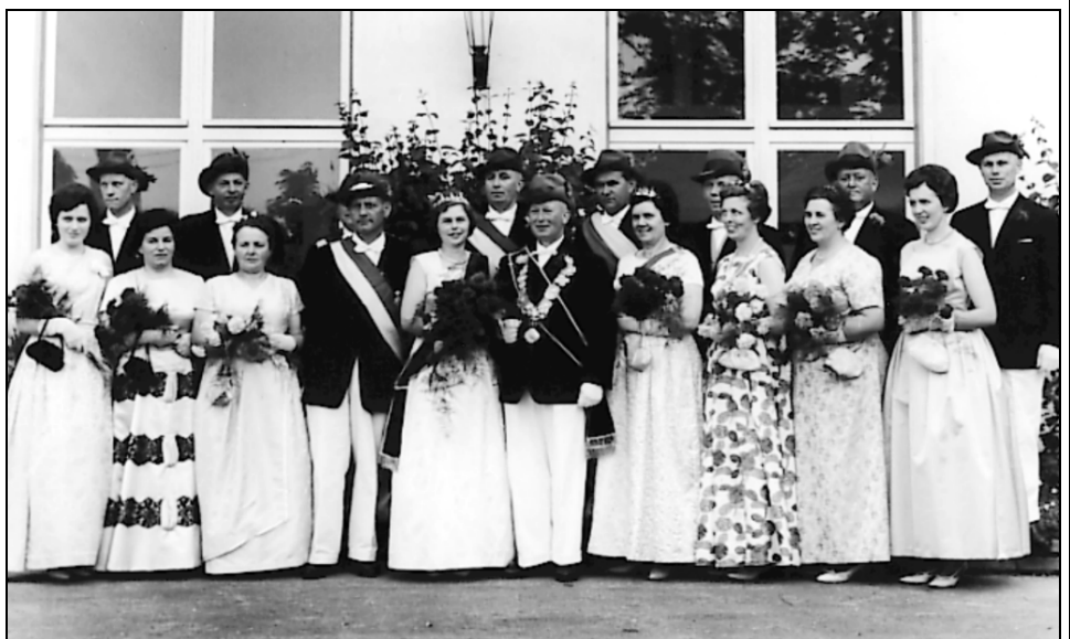
Das Bild rechts zeigt das Königspaar mit seinem Hofstaat: