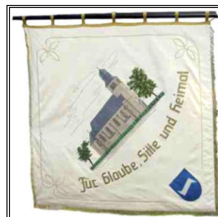
Fahne der 1. Kompanie