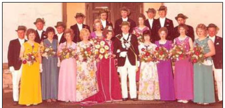
Das Königspaar 1973/1974 mit seinem Hofstaat