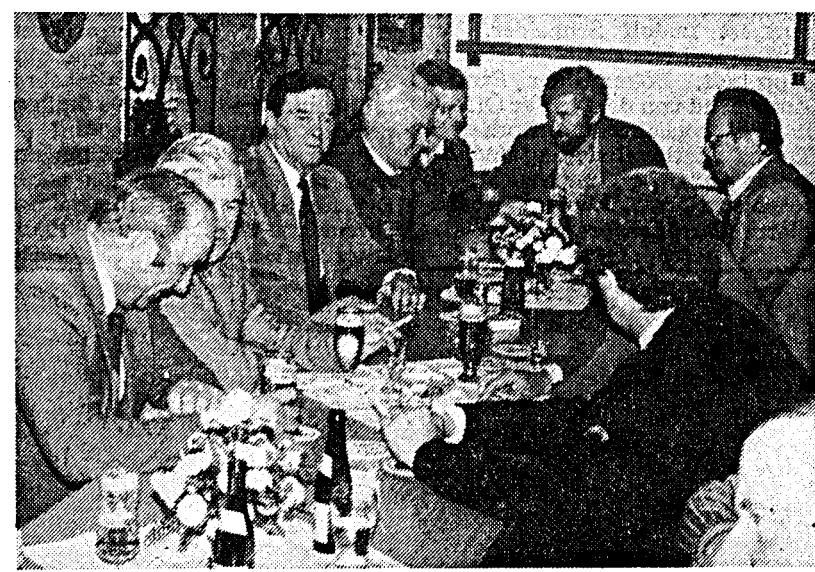
Gut besucht war die Versammlung der Loher Schützen im Gasthof Schültken-Süllentrop. Dabei wurde beschlossen, das Jahresfest am 3./4. und 5. Mai zu feiern.

Südtheater Lippstadt: 16.30; 20.15 Uhr „Foto Finish“