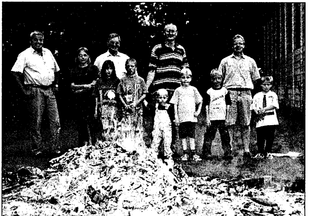
Ein Biwak für Kinder ab acht Jahren führte am Samstag die Kameradschaft ehemaliger Soldaten des Kirchspiels Friedhardtskirchen am Overhager Ententeich durch. An einem lauen Sommerabend konnten die erschienenen Jungen und Mädchen ausgiebig spielen sowie Würstchen vom Grill genießen. Später entzündete man dann ein Lagerfeuer: als krönenden Abschluß des diesjährigen „Ferienpaßes“ für Kinder aus Overhagen, Hellinghausen und Herringhausen. Auf Initiative des Kirchenvorstandes hatten dabei Vereine aus dem Kirchspiel in den Ferien ein buntes Kinder-Programm gestaltet - z. B. mit Ausflügen.

Zahnärzte: Zu erfragen unter Tel.-Nr. (02941) 1655. Apotheken, Lippstadt und Umgebung: Markt-Apotheke, Lippstadt, Marktstr. 13, Tel.: (02941) 5077.