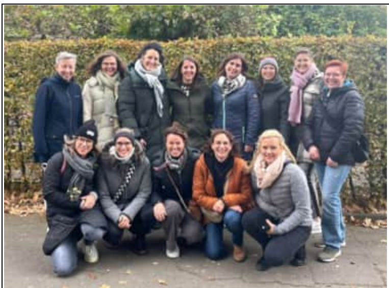
Die Damen vom Schützenverein Dedinghausen