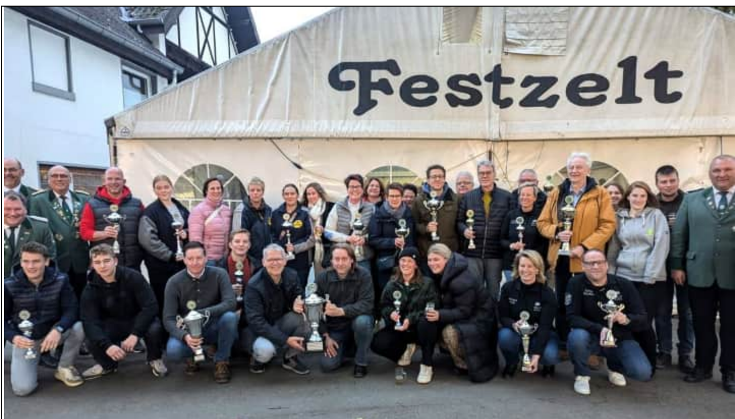
Siegerehrung und schöne Stunden im Festzelt