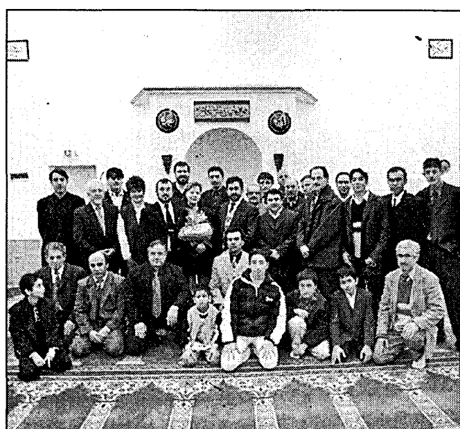
In Lippstadt endete jetzt die Fastenzeit mit einem Feiertagsgebet im Gebetsraum der türkisch-islamischen Moschee an der Mühlenstraße.